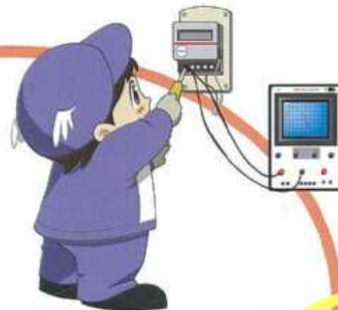
第2種電気工事士 低圧電気取扱作業者特別教育