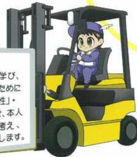
小型フォークリフト特別教育