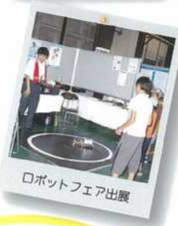
ロボットフェア出展