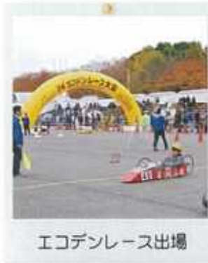
エコデンレース出場