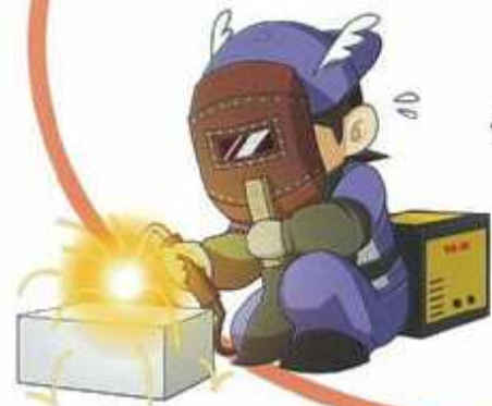
アーク溶接特別教育 ガス溶接技能講習

機械工学科？ 電子機械工学科？ 電気工学科？ 電子工学科？ どの科にしようかな?? *2