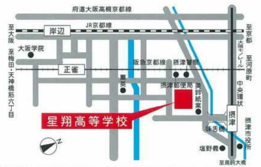
阪急京都線 正雀駅下車/約10分 東海道本線(JR京都線) 岸辺駅下車/約15分 大阪モノレール 摂津駅下車/約10分