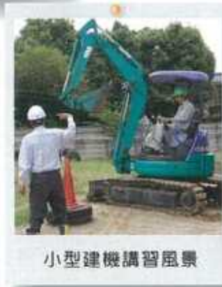
小型建機講習風景

卒業するだけで国家資格がもらえる 「産業用ロボット教示特別教育修了証」 「低圧電気取扱作業者特別教育修了証」 「第3級陸上特殊無線技士」 「第2級海上特殊無線技士」